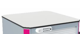
Tablette supérieure en stratifié compact

*Pour la hauteur précise du plan de travail, voir la partie « Données techniques »